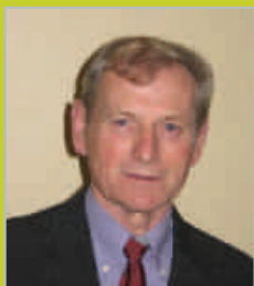
Maire de Romagné