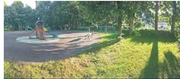
Les espaces verts occupent une place importante dans le travail du service technique

de l'équipe, avec les élus ou avec toutes les autres personnes qui participent à la vie de la commune. J'insiste toujours sur ce point pour nous permettre, avec les habitants, de vivre ensemble et d'être bien tous ensemble ». Entre espaces verts agréables, salles opérationnelles pour les associations ou école où les enfants doivent se sentir bien, le travail ne manque pas.