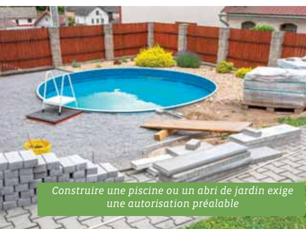
Construire une piscine ou un abri de jardin exige une autorisation préalable

• Pour en savoir plus sur le PLU, rendez-vous sur notre site internet : http://www.romagne35.com/page-UrbanismePLUCadastre-6.4.php