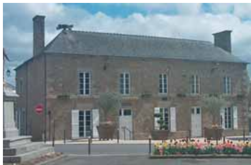
Les habitants ont été interrogés sur l'accueil en mairie