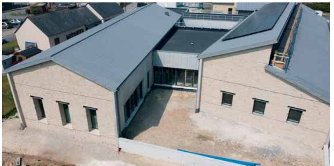
L'espace socio-culturel de Romagné a dorénavant un nom : L'ESCALE

• Enfin, 22 répondants ont manifesté un intérêt pour animer un atelier (62 personnes ont répondu « peut-être ») et 30 habitants ont indiqué qu'ils souhaitent participer au comité des usagers, en laissant leurs coordonnées pour être recontactés.