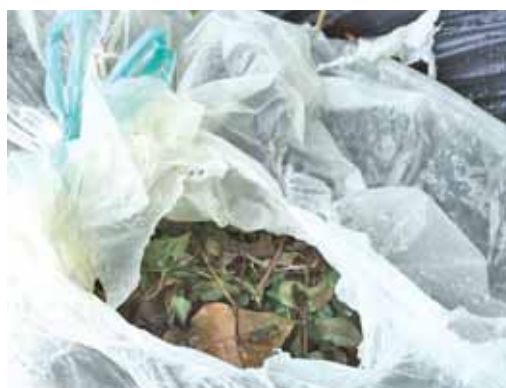
Les sacs jaunes fournis par le SMICTOM ne doivent pas être utilisés pour les déchets verts

** Les contenurs d'apport volontaire papier et verre sont situés rue du stade, à la Renaudière, à la ZA du Coudrais et sur le parking rue de l'Atrium.