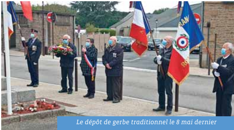
Le dépôt de gerbe traditionnel le 8 mai dernier

De plus, le 9 juin dernier, il y a également eu un dépôt de gerbe au Mémorial britannique de la Tanceraiie, en souvenir des deux aviateurs anglais, abattus par la DCA allemande, lors d'une mission d'observation le 9 juin 1944.