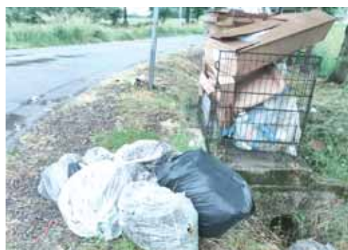
Les déchets verts et les grands cartons doivent être déposés en déchetterie et pas dans les bacs réservés aux sacs jaunes