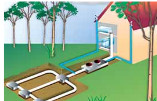
Le contrôle de son installation d'assainissement non collectif est obligatoire

http://fougères-agglo.bzh/content/assainissement-non-collectif-1