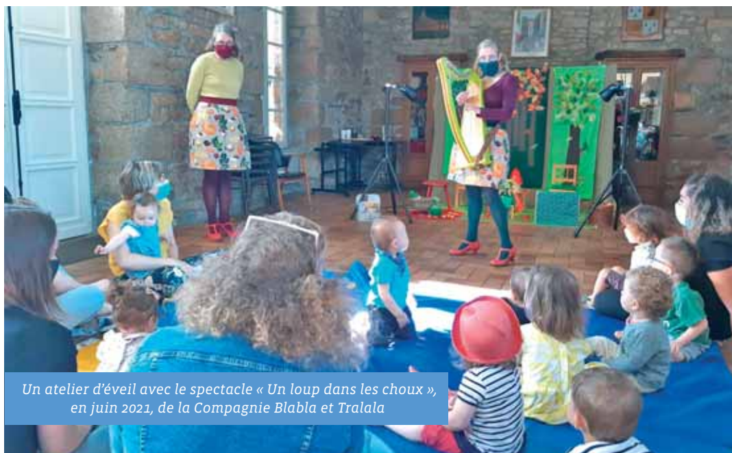
Un atelier d'éveil avec le spectacle « Un loup dans les choux », en juin 2021, de la Compagnie Blabla et Tralala