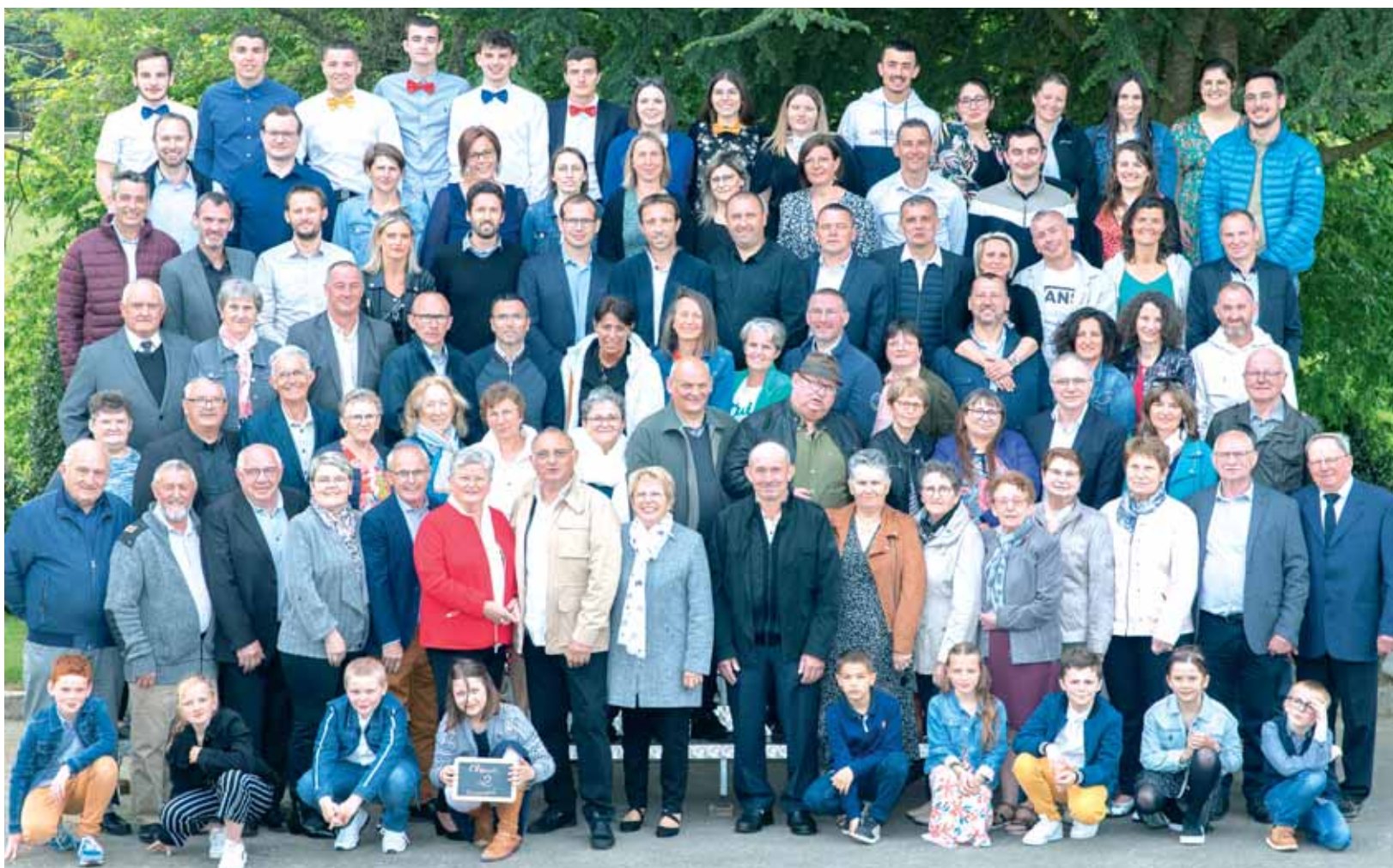
Classes 2022 - Romagné

Comme chaque année, Romagné fête le dernier chiffre de l'année en cours. Place à la classe 2 qui s'est réunie le 30 avril dernier à la salle de l'Atrium. Près de 150 personnes se sont retrouvées toutes générations confondues autour d'un repas et d'une soirée dansante. Ce fut un beau succès avec une belle ambiance. Saurez-vous distinguer tous les présents sur la photo qui sont nés une année en 2 ?