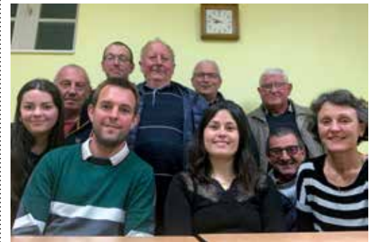
photo souvenir et d'un repas à la salle des fêtes de Saint Sauveur des Landes. Une soirée dansante clôturera les festivités. Pour la bonne organisation de cet événement, il est indispensable de vous inscrire auprès des organisateurs avant le 29 juin prochain.

Si vous êtes né(e) en année 4, vous êtes invité au rassemblement des classes 4, le samedi 28 septembre 2024. La journée débutera par une célébration à l'église de Romagné à 10h, suivie d'une